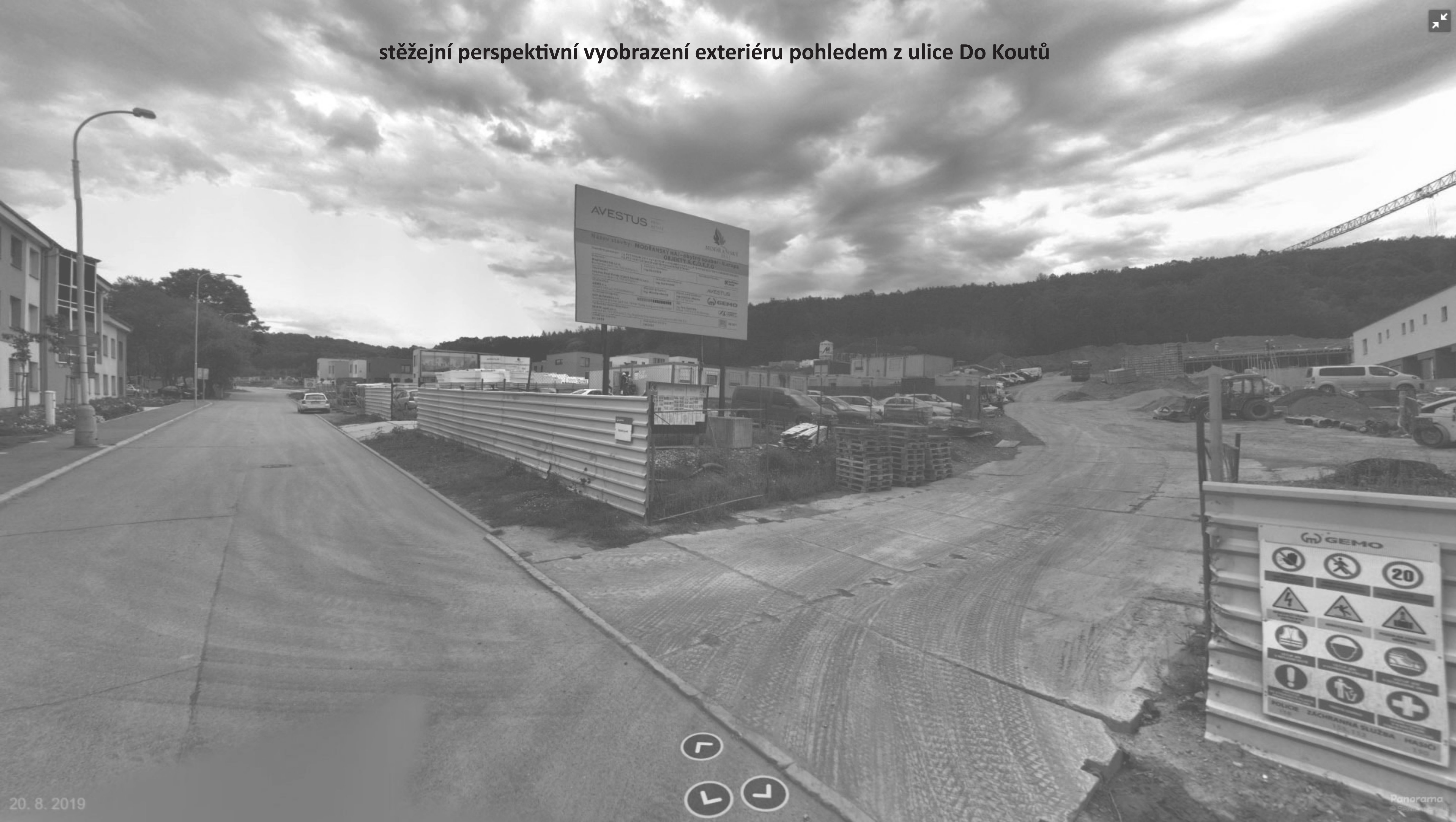
stěžejní perspektivní vyobrazení exteriéru pohledem z ulice Do Koutů